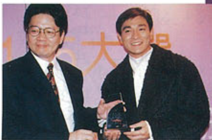
十大勁歌金曲頒獎禮 ▲▶

華 仔在九四年樂壇的成績真是令人欣喜。華仔今年重登最受歡迎男歌手的寶座，足證明華仔的歌唱事業再攀高峯。更重要的是華仔在樂壇上有一個創作上的特破。他以「心酸的情歌」在十大中文金曲中奪得填詞獎，這證明他的創作努力得到大家的認同。