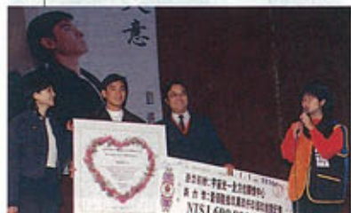
▲“天意”大碟在台灣有驚人銷量達70萬張，而部份收入亦捐作慈善用途