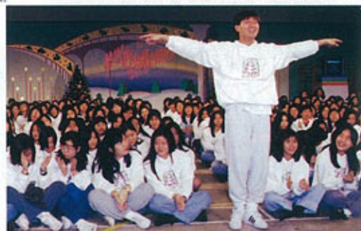
350名Fans一齊和華仔合作拍攝宣傳短片 ▼