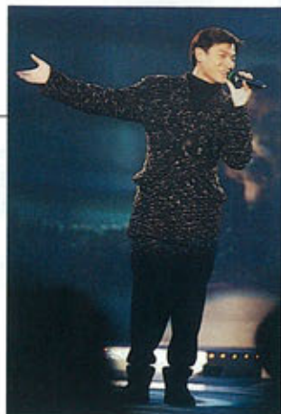
▲ 十大中文金曲頒獎禮