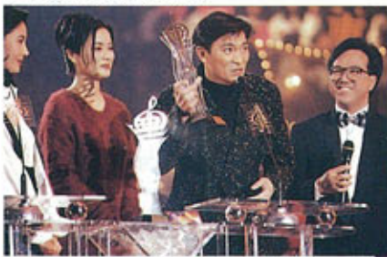
▼ 十大中文金曲頒獎禮