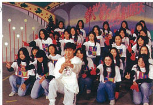
▲ 華仔天地啦啦隊協助表演